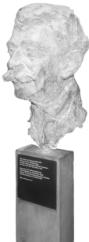
Buste de Coubertin par K. Oswald