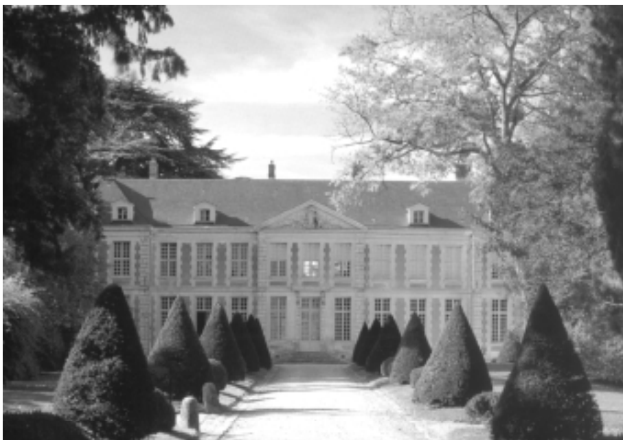
Château de Coubertin, siège de la Fondation de Coubertin